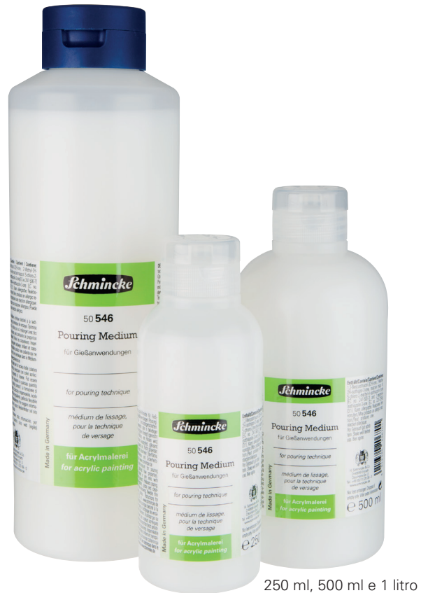
250 ml, 500 ml e 1 litro